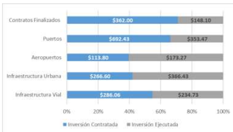
Gráfico 2 Inversión de proyectos App's por sector En millones de dólares